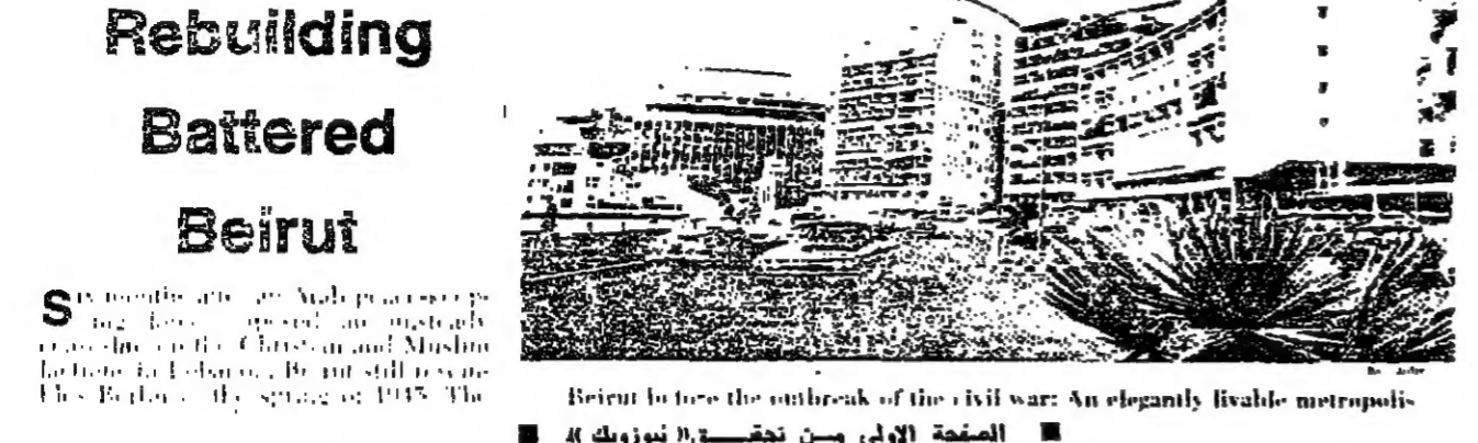
Beirut before the outbreak of the civil war: An elegantly livable metropolis

الموضوعة لها ، تبقى على روحيتها وان كانت تريح منها كل ما يعيق النظر ويجيب الرؤية ويسبب الاختناق السكاني . وفي ما يلي أبرز ما جاء في تحقيق « نيوزويك » :